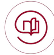
Escuelas Globales de Secundaria*

Divididos en 6 escuelas cada una se premia hasta con US $100,000