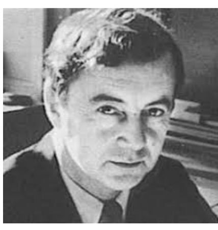
Respuesta ¿Quién es? Del Tablero Sociológico No 39

Principales obras: The presentation of self in everyday life, Asylums., y Stigma: Notes on the Management of Spoiled Identity.