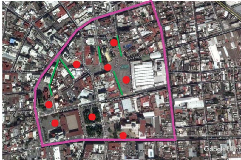
Imagen 3. Primer polígono del Centro Histórico de Irapuato con calles peatonales y espacios públicos

Dentro de esta área se encuentran algunas calles peatonales que permiten la convivencia en algunos de los espacios públicos existentes, estas calles son las siguientes y se encuentran marcadas con líneas verdes en la imagen anterior: